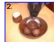
2. 蓋を閉め蓋の上からお湯をたつぶりかけ30秒〜1分程蒸らします。二煎目、三煎目はもう少し時間を長くします。