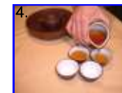
4. 茶杯に注ぎ分けます。