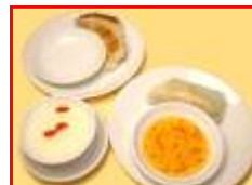
生春巻・餃子・杏仁