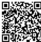
日替りカレンダー

スマートフォンや パソコンなどから 日替りカレンダーを ご覧頂く事が 出来ます。