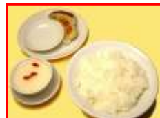
ライス・餃子・杏仁豆腐