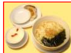
ミニラーメン・餃子・杏仁